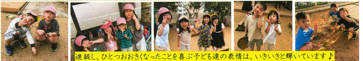
進級し、ひとつおおきくなったことを喜ぶ子ども達の表情は、いきいきと輝いています♪